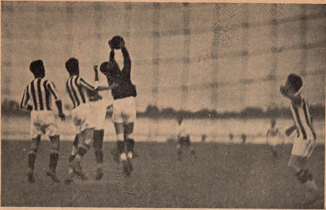
Fragment z zawodów drużyny ligowej K. S. Cracovia.

tak w kraju jak i zagranicą, gdzie dotąd jest najbardziej znana, nauczycielka sztuki piłkarskiej dla innych dzielnic Polski w latach 1920 i 1921, miała w swych szeregach graczy o najgłośniejszych nazwiskach i największą ich ilość dała reprezentacji Polski, zwłaszcza w pierwszych latach jej występów, wydała wreszcie wielkich działaczy i organizatorów sportowych. Nic dziwnego, że mimo przejściowych okresów słabości cieszy się ona niezwykłą popularnością w całej Polsce i że jej jubileusz jest polskim świętem sportowym w całym tego słowa znaczeniu.