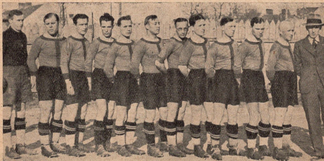
Drużyna Ligowa K. S. Garbarnia (Mistrz Polski).

Horeschovsky (26 lat) był bramkarzem amatorskiej reprezentacji Austrii. Od szeregu lat broni stale świątyni Wiednia, co w Wiedniu, posiadającym moc talentów bramkarskich, świadczy najlepiej o kwalifikacjach tego gracza.