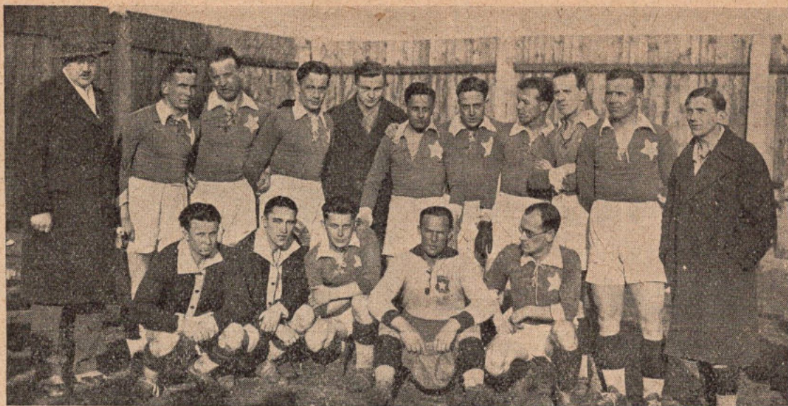
Drużyna Ligowa T. S. Wisła (Vicemistrz Polski).

zdobycie pucharu środkowej Europy, o który walczą corocznie po dwie najlepsze drużyny czterech krajów: Austrii, Czechosłowacji, Węgier i Włoch. O klasie Wiednia świadczą najlepiej świetne wyniki z roku ubiegłego i bieżącego.