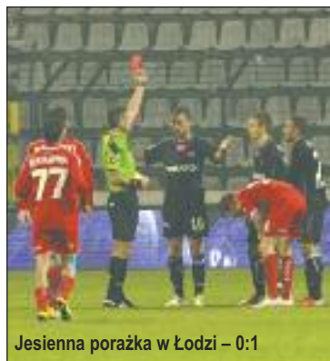
Jesienna porażka w Łodzi – 0:1