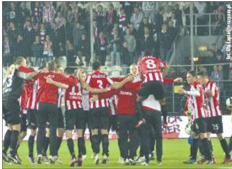
Tak cieszyli się piłkarze Pasów po pierwszym ligowym zwycięstwie w roku 2012.

W ostatnich dwóch kolejkach Pasy zdobyły trzy punkty, wygrywając u siebie z Podbeskidziem Bielsko-Biała (3:1) i ponosząc porażkę z Polonią w Warszawie (1:2). Cracovia traci obecnie do bezpiecznej pozycji cztery punkty i pod warunkiem, że wygra najbliższy mecz z Widzewem, to jej szanse na utrzymanie będą wciąż całkiem realne!