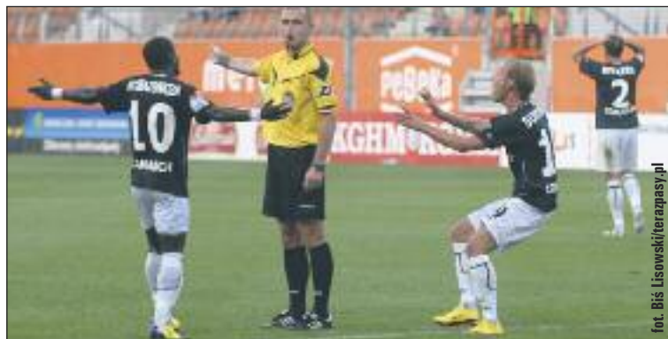
Wynik jesienno meczu obu drużyn wypaczyły decyzje nieudolnego arbitra.