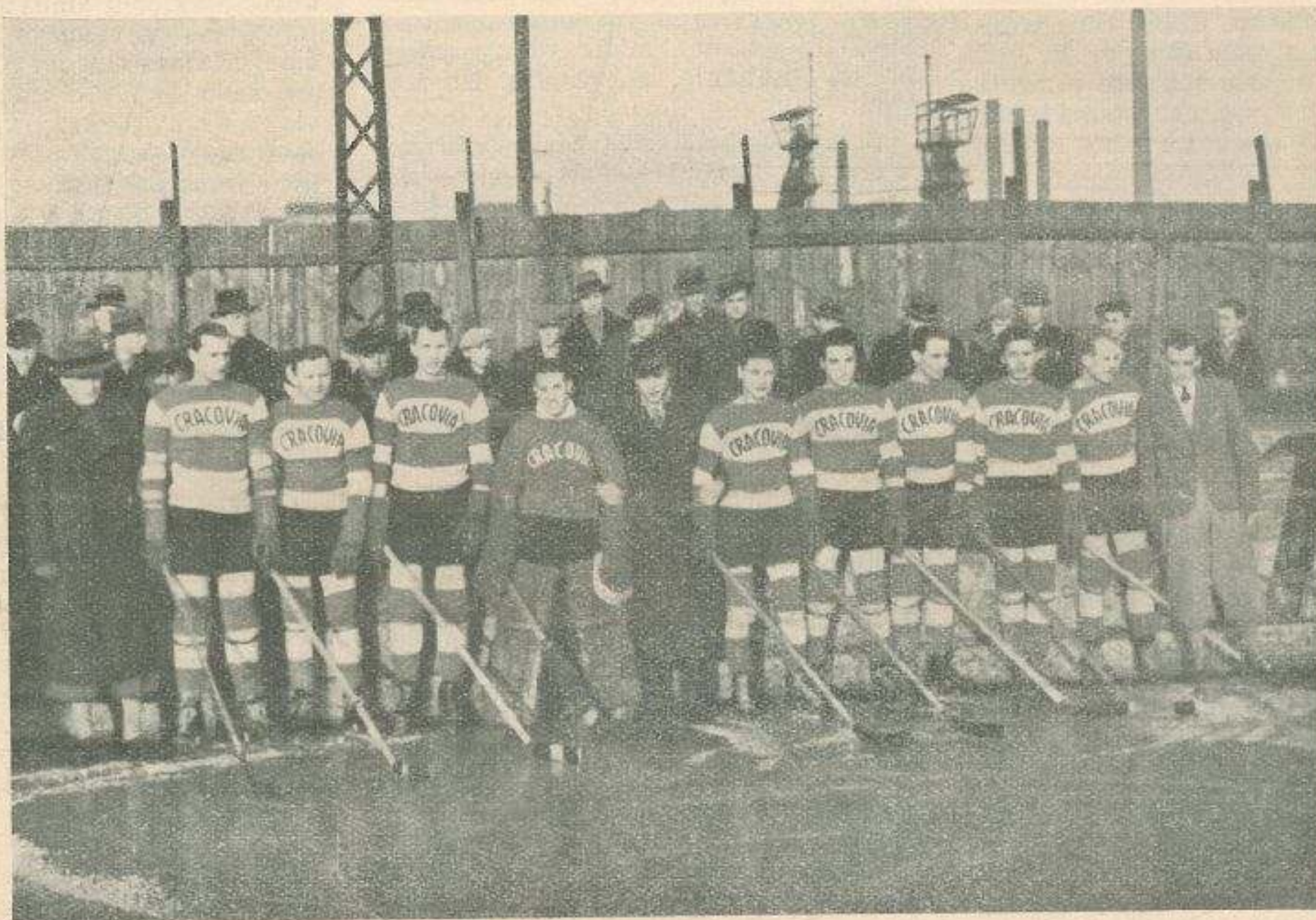
I. Drużyna K. S. Cracovia. Mistrz Polski w hokeju lodowym na rok 1936/7.