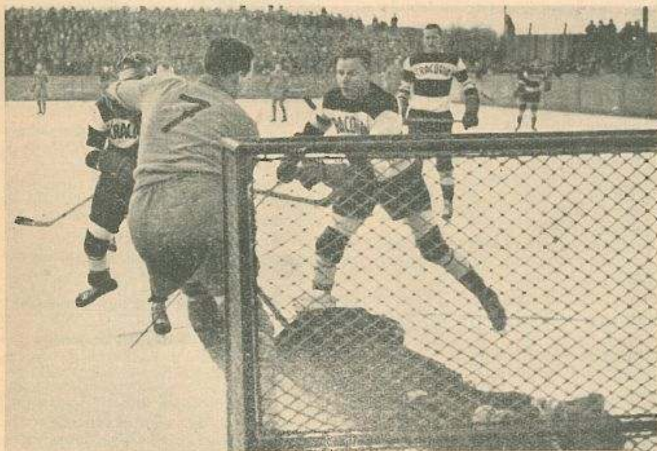
Moment z zawodów B. K. E. (Budapeszt) — Cracovia. Pod bramką Cracovii.

W pierwszych zawodach ze Zwierzynieckim K. S. zwyciężyli nasi w stosunku 6:2, następne zawody z W. K. S. Wawel zakończyły się wynikiem nierozstrzygniętym 4:4, przyczem wojskowi prowadzili do pauzy 3:1, jednak po poużyciu lepszej technice biało-czerwonych, którzy zdołali wyrównać.