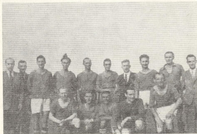
1943 rok Drużyna „Wisły” biorąca udział w jubileuszu 15-lecia Łagiewianki: