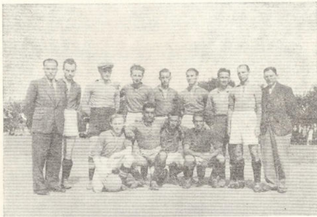
6.07.1941 r. „Wisła”: