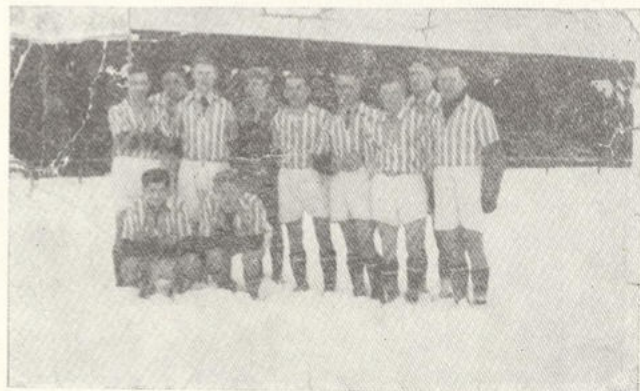
KS „Zwierzyniecki” (28. 1. 1945 r. Boisko Wisły):