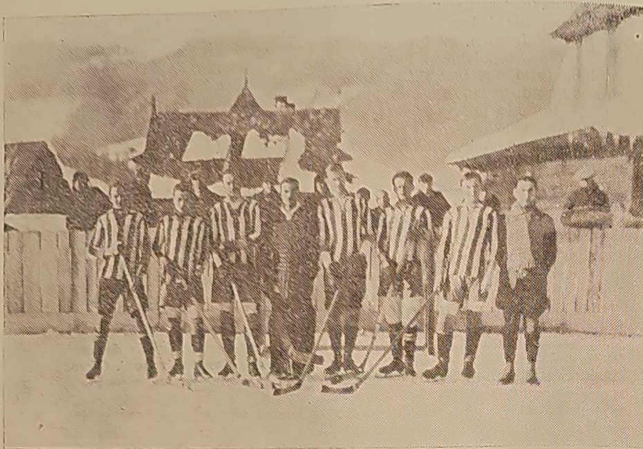
Tak oto prezentowała się hokejowa drużyna Cracovii w r. 1927. Koszulki piłkarskie ubrane na swetry zastępowały dresy pełnym zapalą zawodnikom. O bodyczkach, nałokietnikach, nagolennikach czy hokejowych rękawicach jeszcze wówczas nie słyszano.