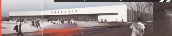
Widok od strony Muzeum Narodowego i al. Focha